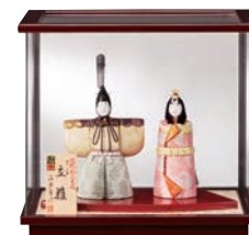
金林真多呂 作 ケース入 木目込 立びな 75,600円 (間口30×奥行24×高さ27cm) ■6階=呉服