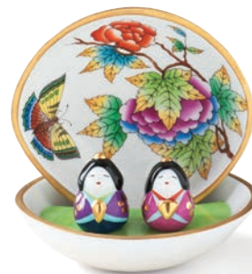
〈ヘレンド〉ヴィクトリア・ブーケ貝雛 75,600円(高さ約10cm) ■6階=特選洋食器

ひな人形は立春(2月4日頃)を過ぎた頃から雨水の日(2月19日頃)に飾るのが一般的に良いとされています。小さな女の子のいない家庭でも現代では、春の訪れを寿ぐ風雅なインテリアとして大人の女性たちに注目されています。