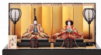
市川豊玉 作 衣裳着親王飾り 334,800円(間口68×奥行42×高さ36cm) ■6階=呉服

ひなまつりの起源は古代中国の「上巳節」。災いをもたらす邪気が入りやすい季節の変わり目の旧暦3月最初の巳の日。この日に水辺で穢れを祓う習慣が日本に伝わり、平安の宮中行事にとりいられると、人形に穢れを移し、川や海へ流したりするように。やがて男女一対の雛人形に厄を引き受けてもらい、子供の健やかな成長を願うようになりました。これが武家社会に広がると、5月5日の男子の節句に対して、3月3日は女の子の節句に。桃の開花と重なる時季で、桃の木が邪気を祓う神聖な木と考えられていたので、桃の節句として定着したのです。