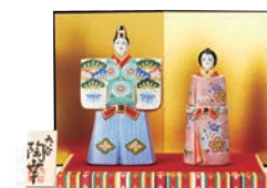
九谷焼 5.5号立雛 紋盛松竹梅 27,000円(間口24×奥行16×高さ21.5cm) ■6階=和食器