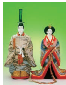
栗崎和風 作 皇宮雛 2,376,000円 (高さ約55cm) ■6階= リビングプロ ーション2