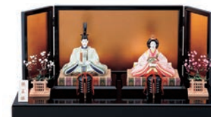
〈ノリタケ〉親王揃 162,000円 (間口55×奥行28×高さ25.2cm) ■6階=特選洋食器