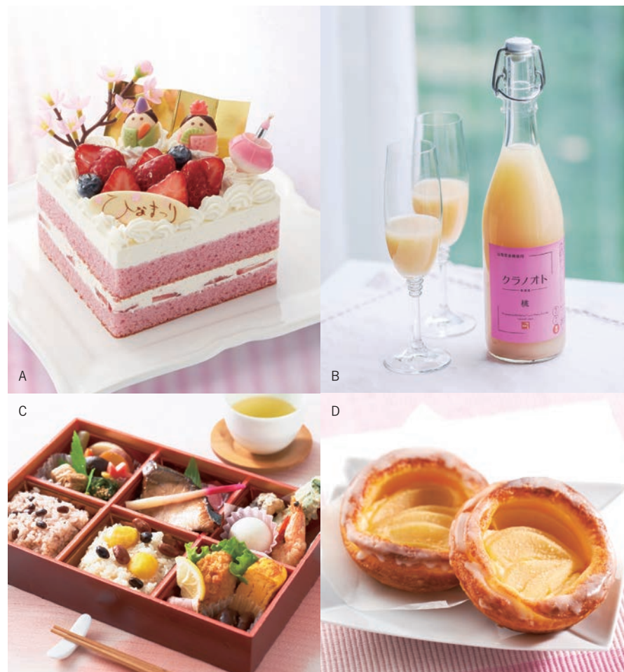
A. 可愛いお雛さまとお内裏さまが並んだショートケーキです。<クローバー>ひなまつりショートケーキ 3月1日(火)~3日(木)の販売 2,376円(10.5×10.5×高さ約5.5cm) ■地階=洋菓子