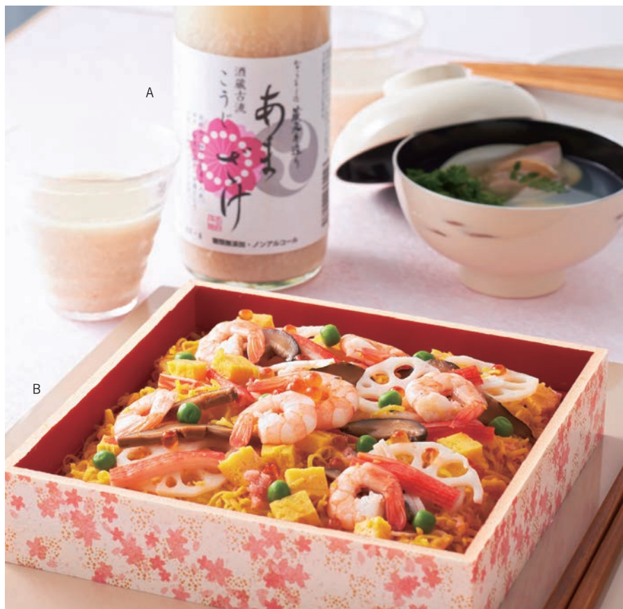
A. 季節の変わり目の滋養に。麴の力でじっくり糖化させ、糖類は不使用。米本来の甘みを楽しめる濃厚な甘酒です。奈良<美吉野醸造>花巴 酒蔵古流 こうじあまざけ 1,080円(ノンアルコール/780g) ■地階=和洋酒 B. 海老(長寿)、蓮根(見通しがきく)、豆(まめに働ける)など縁起の良い具材を、春らしく華やかに盛り付けました。<京樽>姫ちらし盛合せ 3月3日(木)限りの販売 1,728円(2人前) ■地階=惣菜

体調を崩しやすい季節の変わり目に邪気を祓うと言われている桃をはじめ、春の訪れを伝える旬の食材や縁起の良い食材が使われる、ひなまつりの食べ物。女の子の幸せを願いながら、三世代揃ってお祝いのパーティを。