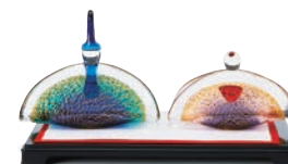
〈マルティグラス〉 ガラスのひな人形 14,040円 (台座 間口27×奥行17cm) ■6階=和食器