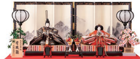
京都采加 作 衣裳着親王飾り 540,000円 (間口120×奥行95×高さ48cm) ■6階=呉服