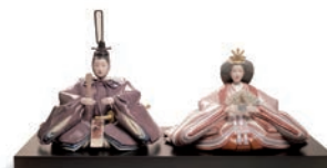
〈リヤドロ〉雛人形 親王飾り 334,800円(間口55×奥行28×高さ28cm) ■6階=特選洋食器